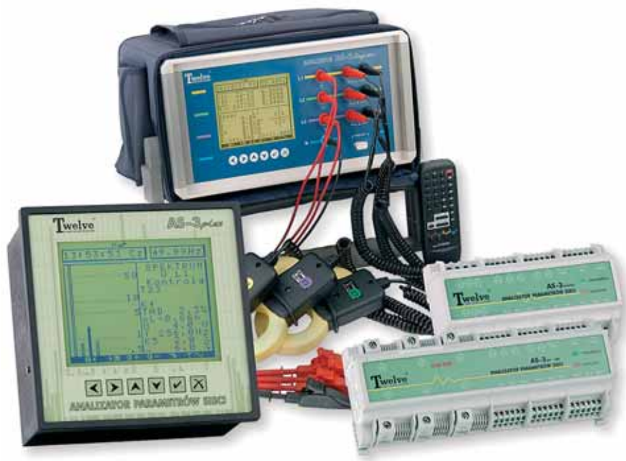
Analizatory z rodziny AS-3

Jednak w chwili obecnej, przy zupełnym braku przepisów wykonawczych dotyczących zarówno metod pomiarowych, jak i samych urządzeń do wykonywania pomiarów, zdecydowana większość dostawców nie jest technicznie przygotowana do