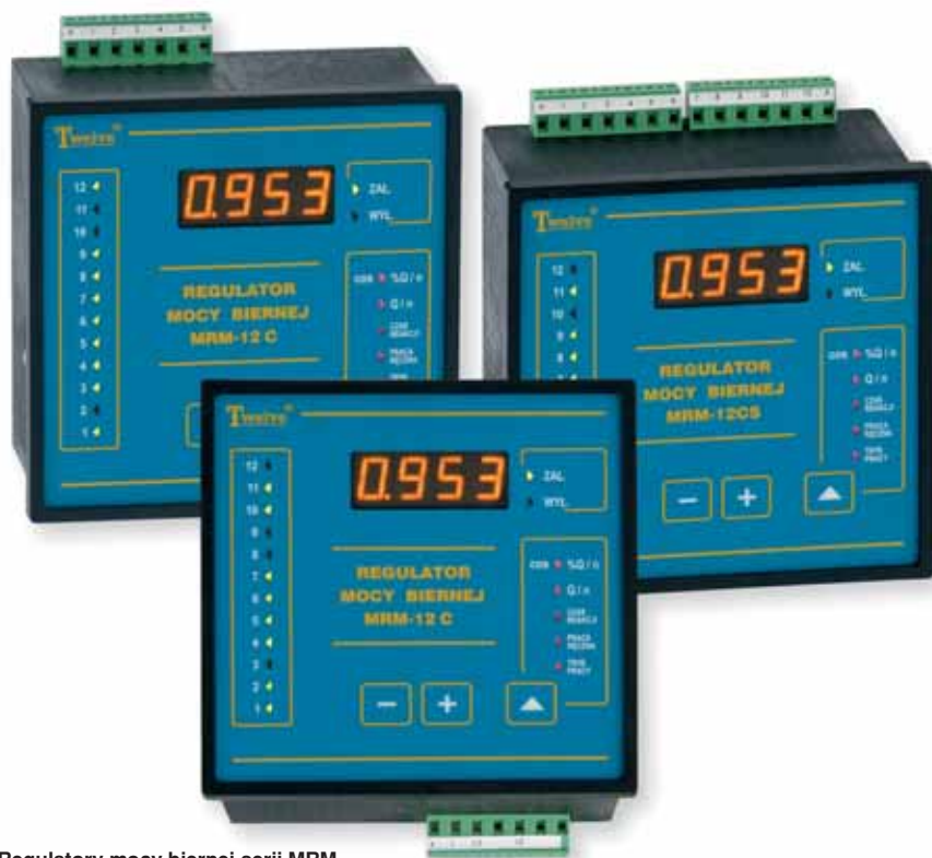
Regulatory mocy biernej serii MRM

ściem zdarzenia, które zarejestruje licznik. Jest to możliwe, gdyż rejestrowane w licznikach parametry są wartościami uśrednionymi za okres pomiarowy: 15 minut dla mocy przyłączeniowej i miesiąc dla tangensa \varphi . W tym czasie posiadając odpowiednie urządzenia i systemy można skutecznie przeciwdziałać tym przekroczeniom.